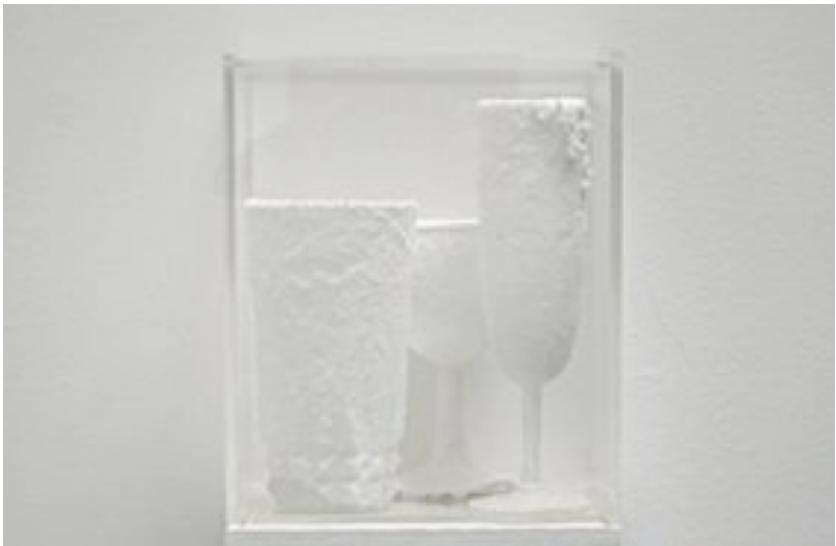
SEDIMENTS - BACCARAT, 2010 triptyque chlorure de sodium sur cristal 22 x 17,5 x 13 cm oeuvre unique