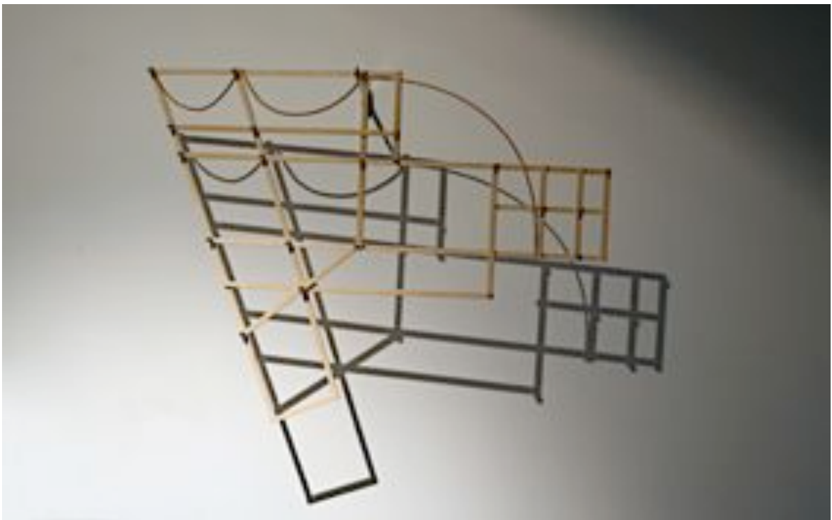
CARTE MEMOIRE – LOS ANGELES, 2009 bois, 20 billes inox 57 x 70 x 2 cm œuvre unique