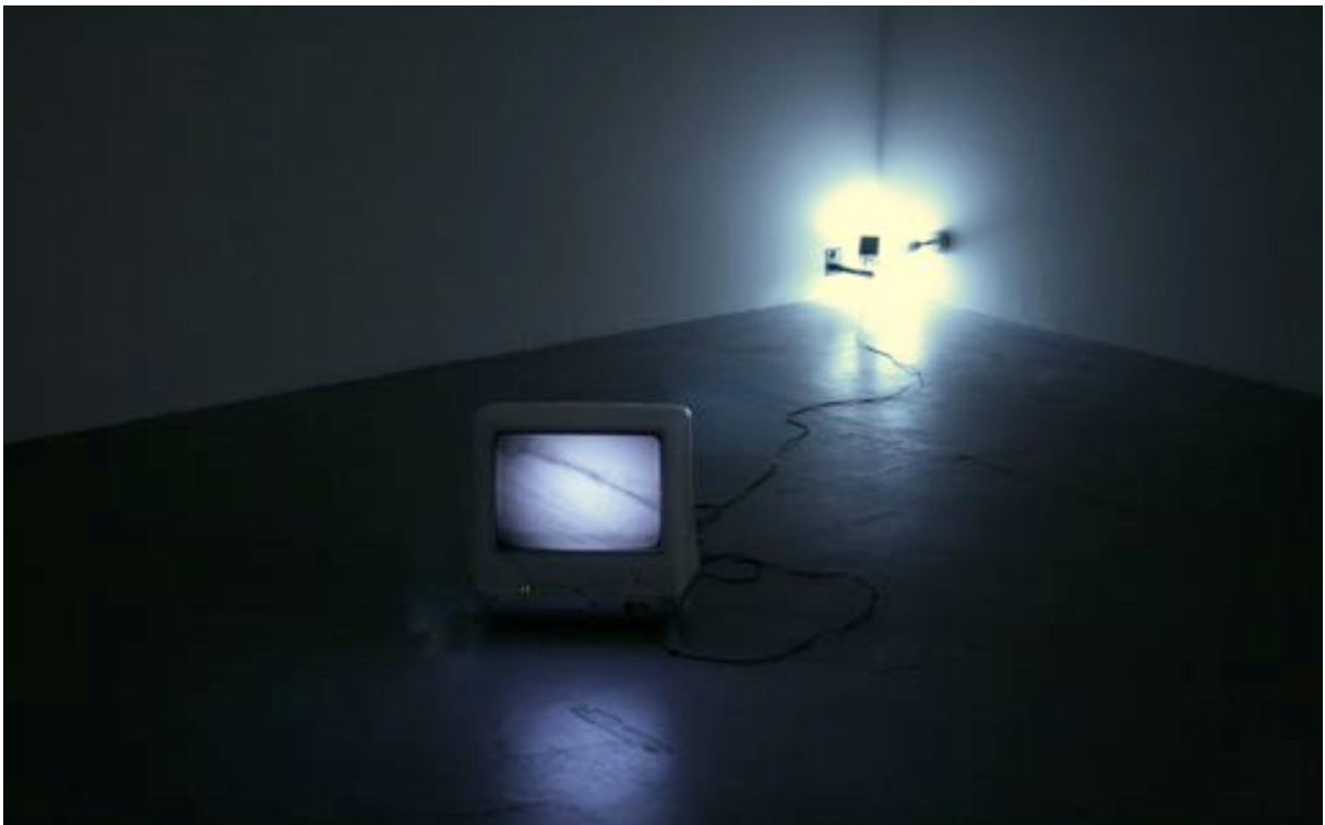
YESTERDAY, 2009 installation vidéo noir et blanc, muet caméra de surveillance, moniteur, toile d'araignée édition de 3