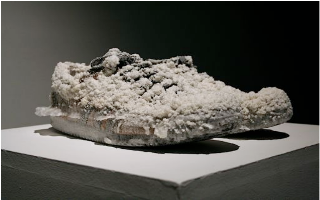
SEDIMENTS - WENDOVER, 2010 chlorure de sodium sur cuir peinture 45 oeuvre unique