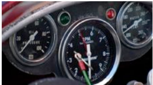
SPEED OF EYE, 2010 vidéo, couleur, son durée 7 mn 20 édition de 5