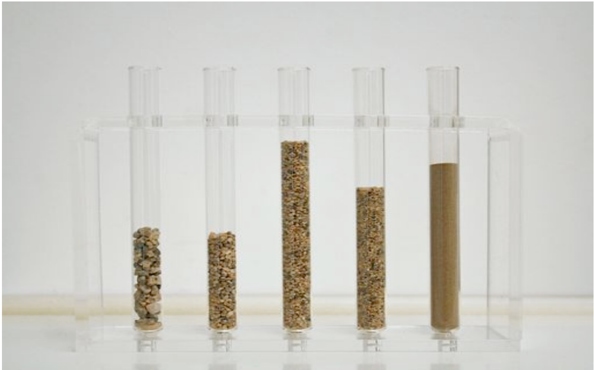
WHAT THE DESERT IS MADE OF - MOJAVE, 2010 roches, verre et plexi 12 x 16 x 4,5 cm oeuvre unique