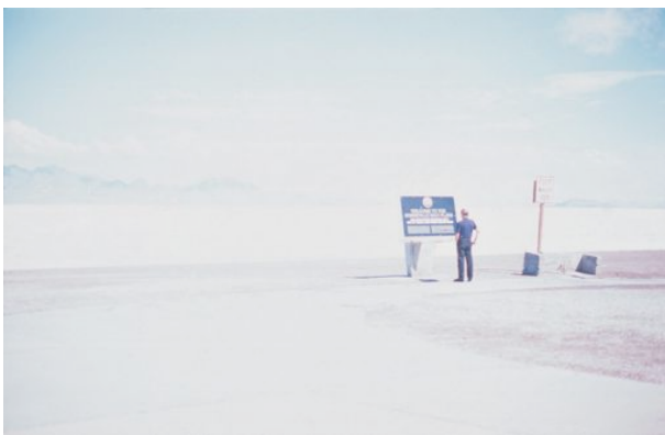
VANISHING ISLAND, 2010 5 photos couleur 9 x 12 cm chacune édition de 5